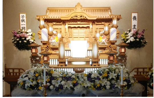
白木祭壇前アレンジメント