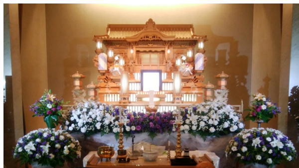
白木祭壇前アレンジメント